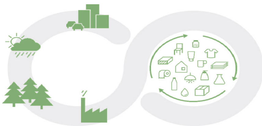
Bild 1. Den cirkulära bioekonomin.