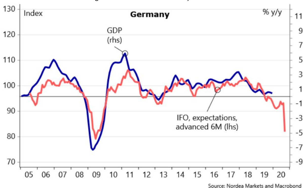
Diagram 1 Korrelationer IFO och tysk tillväxt

Enkät svar från företagen tyder på akut läge