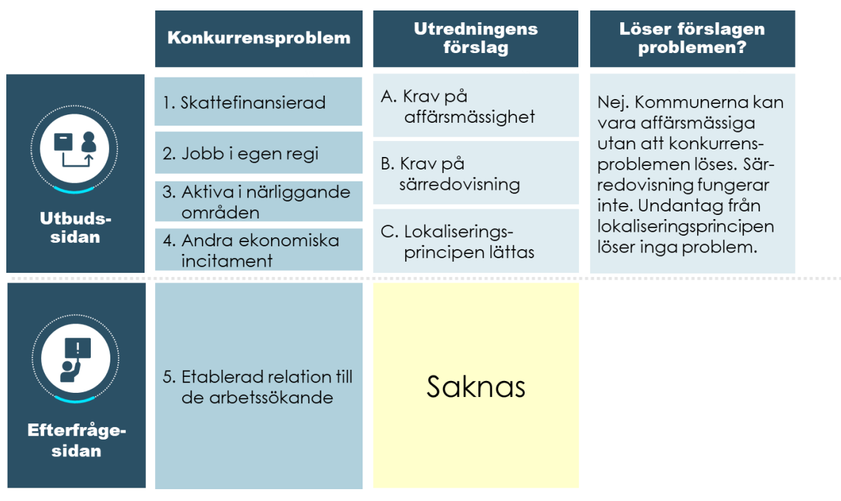
Figur 3 Vilka snedvridningar av konkurrensen träffas av utredningens förslag?

Förslaget om att införa ett krav på affärsmässighet förutsätter att kommunerna ska ges vissa undantag från självkostnadsprincipen och förbudet mot vinstdrivande verksamhet när kommunerna lämnar anbud till eller deltar i ett valfrihetssystem hos Arbetsförmedlingen. Enligt utredningen skulle förslaget leda till ökad konkurrensneutralitet mellan kommuner och privata utförare.