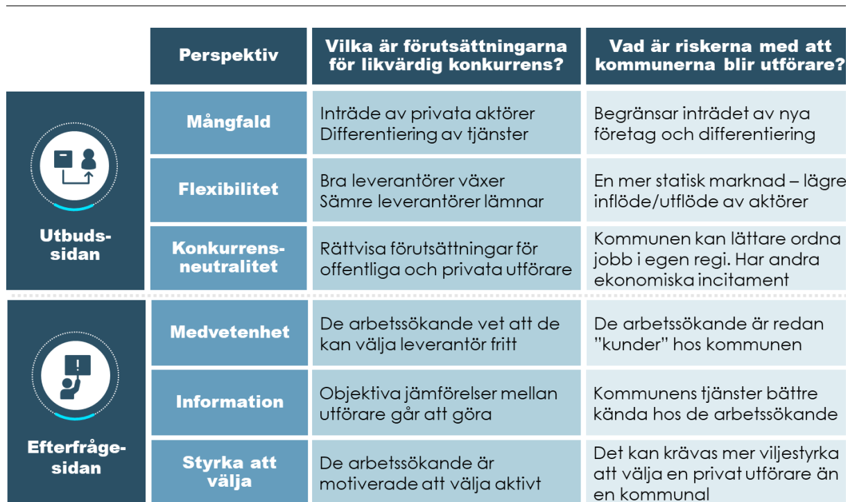
Figur 1 Förutsättningar för konkurrens – vad sker om kommunerna blir utförare?