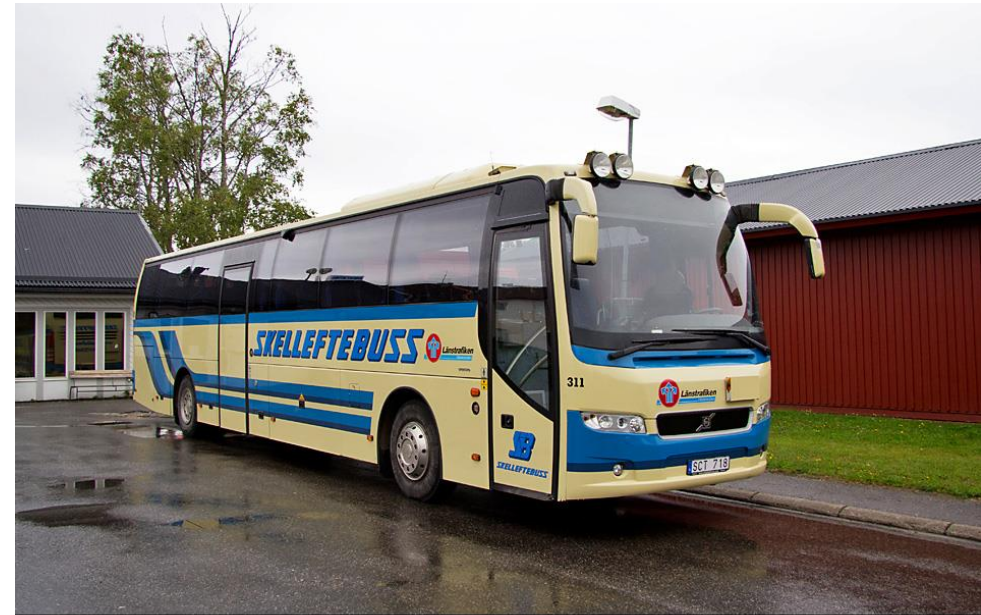
Skelleftebus 311 Byske busstation 7/8 2013